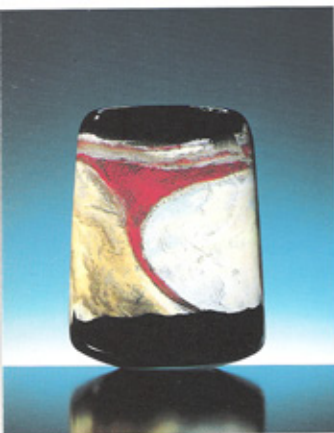
Alain et Marisa Bégon. Souffleurs de verre. Pièce unique. 1995. Hauteur : 43,5 cm.

Les peintres comme les sculpteurs ont toujours cherché à jouer avec la lumière, à utiliser les transparences, à rendre vivantes leurs œuvres. Pour cela le verre fut utili-