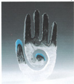
Colin Reid. Artiste anglais. "Cristal, cobalt, basal".

Non seulement lorsqu'il s'agit de scènes figuratives, mais aussi pour l'abstrait, par la modulation des lumières qu'introduisent les différents dépolis. Ici se trouve le domaine de la subtilité. Subtilité qui fait jaillir des zones obscures aux côtés d'autres plus ou moins lumineuses et disséminées parmi des plages de transparence totale. L'artiste joue avec le rayon lumi-