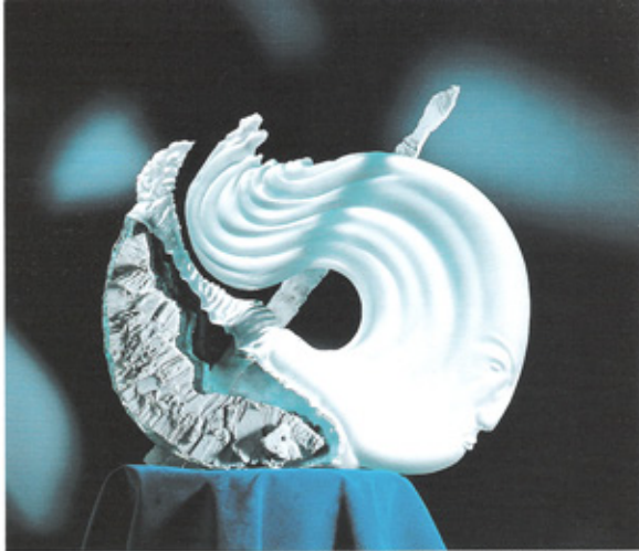
Gilles Chabriat. "Deferlante". Verre sablé - fer.

Non seulement lorsqu'il s'agit de scènes figuratives, mais aussi pour l'abstrait, par la modulation des lumières qu'introduisent les différents dépolis. Ici se trouve le domaine de la subtilité. Subtilité qui fait jaillir des zones obscures aux côtés d'autres plus ou moins lumineuses et disséminées parmi des plages de transparence totale. L'artiste joue avec le rayon lumi-