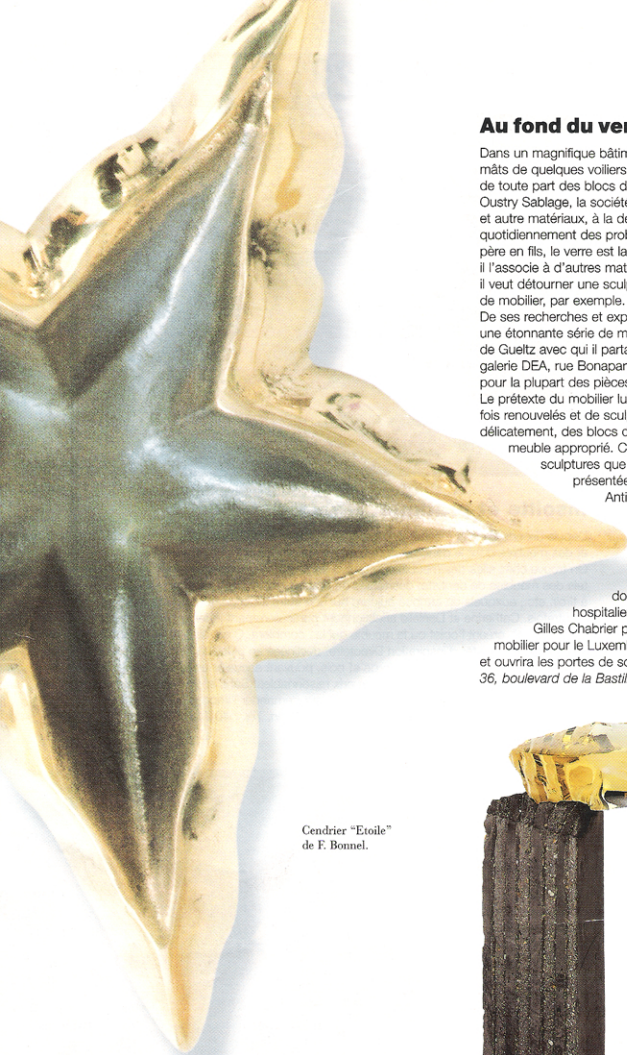
Cendrier "Etoile" de F. Bonnel.