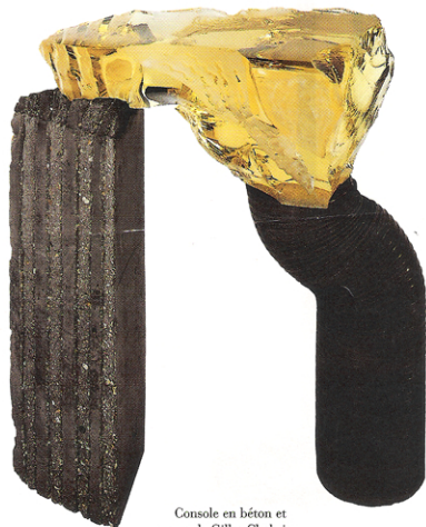
Console en béton et verre de Gilles Chabrier.