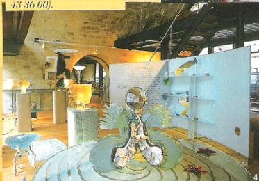
4. Silice, le verre dans tous ses états.